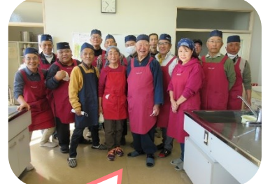
できたお蕎麦は持ち帰ります。