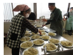
今日の出来栄えは?