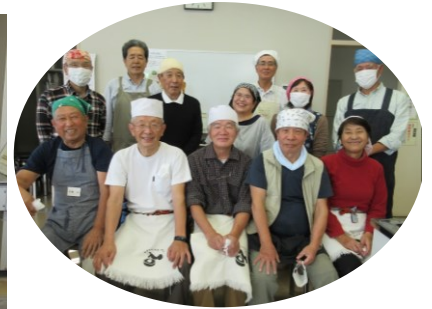
美味しいおそばをいただきました