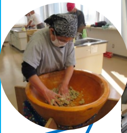
そばの香りが漂う、水回し