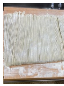
出来上がり！ 茹でて食べます。