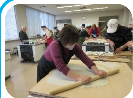
〇から口へ、のします