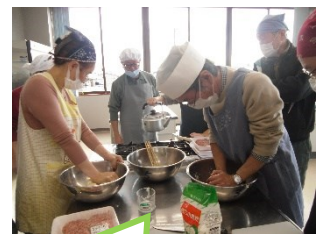
今日は水餃子を作ります。