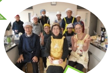
楽しみながら中国の文化を知ってください！

連絡先： メール: akrskt.g@gmail.com TEL: 090-7737-2906（サカテ）