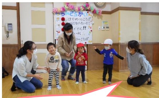
ミニ運動会楽しかったね☺