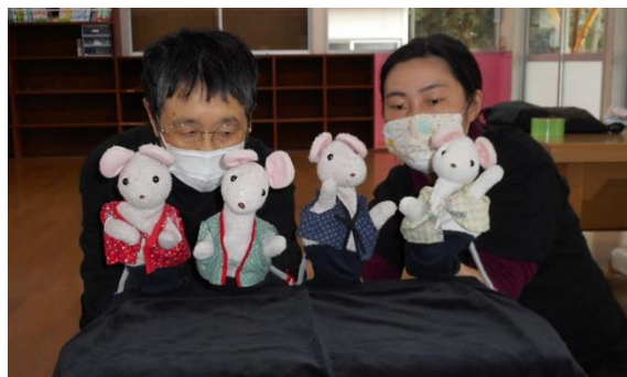
ポッキーグループ