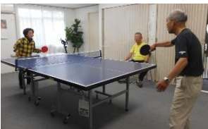
卓球して汗 をかいたら 冷たい飲み 物をどうぞ。

高齢化が著しい筑見には、喫茶室を中心とした楽しさの拠点『筑見ふれあい館』があります。筑見ふれあい館は、多くの人が自分の家に閉じこもらないように、旧自治会館を改装したものです。喫茶室入室料1日100円で、コーヒー、紅茶、お茶などをマスターが提供。多目的室では卓球ができ、子ども図書館もあります。住民が集い交流することで孤独死とは無縁の支え合いのある筑見を目指しています。