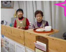
今日のマスター です。ようこそ