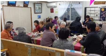
お菓子を持ち 寄りにぎ やかです。