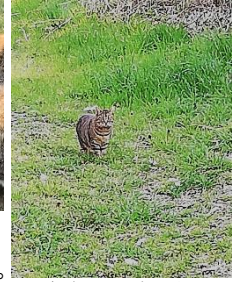
世話をしてくれる人が来た時には、リラックス。