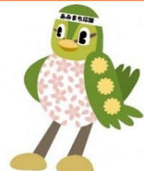
町民活動センターマスコット キャラクター“あみエール”