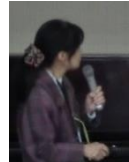
アニマル セラピー協会