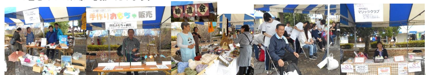
茨城県・犬猫共存推進会

朝9時ころ、阿見町上空には雨雲が停滞。天候が心配されましたが、しかし一転、その後は晴れ。多くの皆様のご来場に感謝いたします。