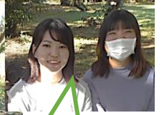
いばねこメンバーです。

茨城大学農学部敷地内の地域猫の避妊・去勢、餌遣り、健康管理を行うことを目的として結成されました。地域の皆様と連携して猫を管理し、地域のイベントで地域猫の啓発活動を行います。農学部敷地内の地域猫の行動域や生活圏は、まだ分かっていません。GPSを使用した研究にも取り組んでみたいと考えています。