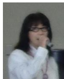
茨城県・犬猫 共存推進会