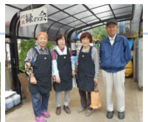
プール掃除がらくらく