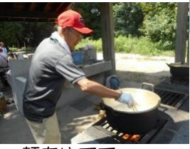
麺をゆでて・・・