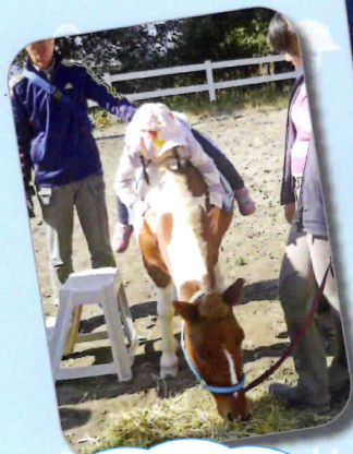
慣れるとこんなことも できちゃうよ。