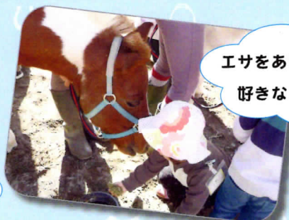
エサをあげてお友達になろう。 好きなエサがちがうんだよ