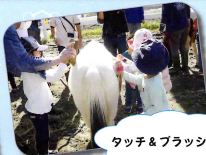
タッチ & ブラッシング